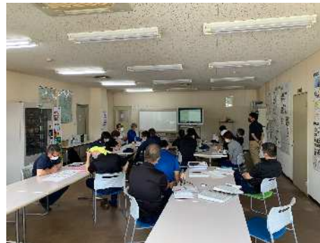
経営幹部から工程メンバーまで 参加した指導の様子

各工程リーダーのみならず，メンバー全員が参加したことで，QC活動の考え方・手法の理解が社内全体に浸透，意識改革に大きくつながった。