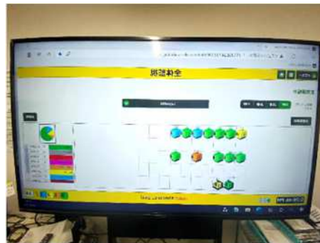
「全体監視」 15台の設備をネットワーク接続し リアルタイム状況を一括表示

現場でのIT課題について、高速検索ツールの紹介やソフトウェアの導入支援を受け、社員が業務課題について積極的に試行錯誤し、意識改革に大きくつながった。