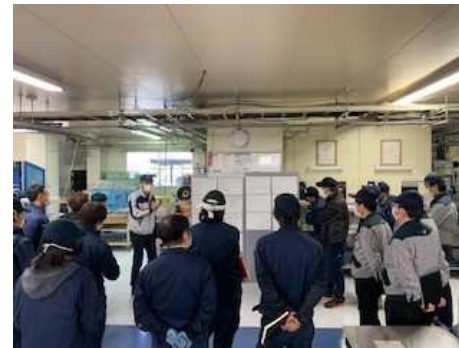
現場における支援風景