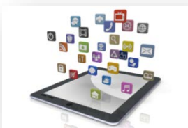
スマートデバイスの ビジネス利用