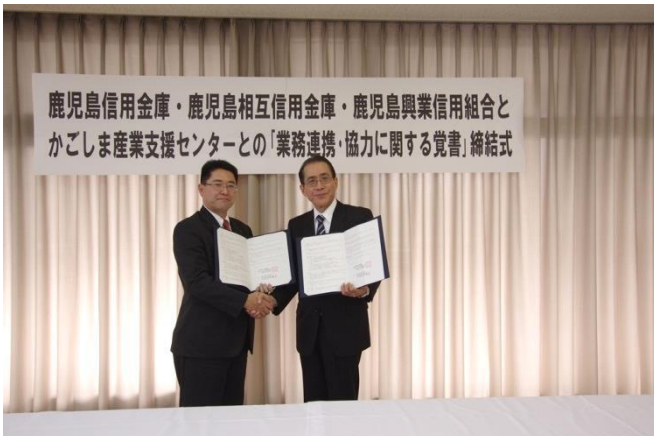
(左) 相互信用金庫 (右) 産業支援センター 秋葉副理事長 六反理事長